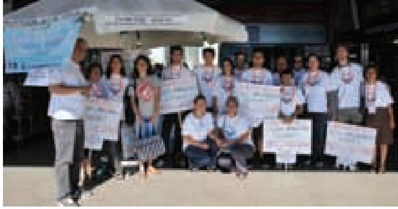
belediyeleri, kayıt dönemi olan 2-8 Eylül 2013 tarihleri süresince gençlere yardımcı olabilmek için yoğun bir mesai harcayacak.

Görevliler, kente ilk kez gelen öğrencilerin endişelerini azaltmak, onlara destek olmak, öğrencileri kayıt noktalarına ulaştırmak ve kayıt dönemi süresince barınmaya yönelik sıkıntıları olan gençlere ve yakınlarına kısa süreli barınma olanakları sağlamak amacıyla rehberlik yapacak.