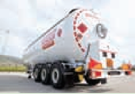
OKT Trailer'in tecih ALCOA ■ 6'da