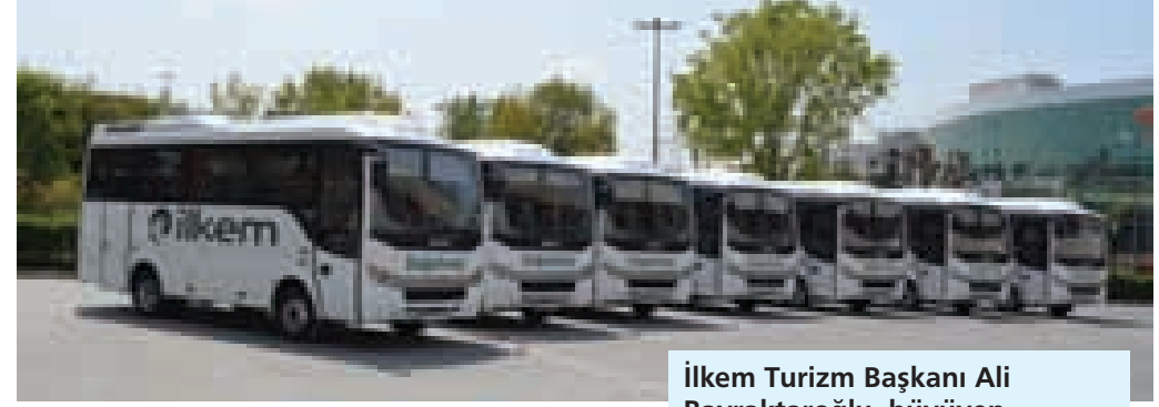
İlkem Turizm Başkanı Ali Bayraktaroğlu, büyüklen filosuna önemli katkı sağlayan Gülsoy Otomotiv ve Atalay Ticaret'e, değerli desteklerinden dolayı teşekkür etti.

İlkem Turizm, 2013-2014 eğitim öğretim yılında 1200 araçla yaklaşık 14 bin öğrenci taşıyacak. Personel taşımacılığında ise 650 araç ile yaklaşık 8.500 kişinin ulaşım hizmeti sağlanacak.