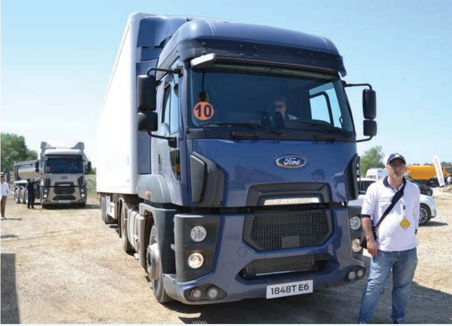
■ Erkan YILMAZ / ANTALYA