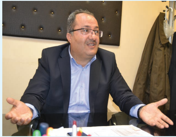
Kırmızıgül: Vize engeli zarar veriyor