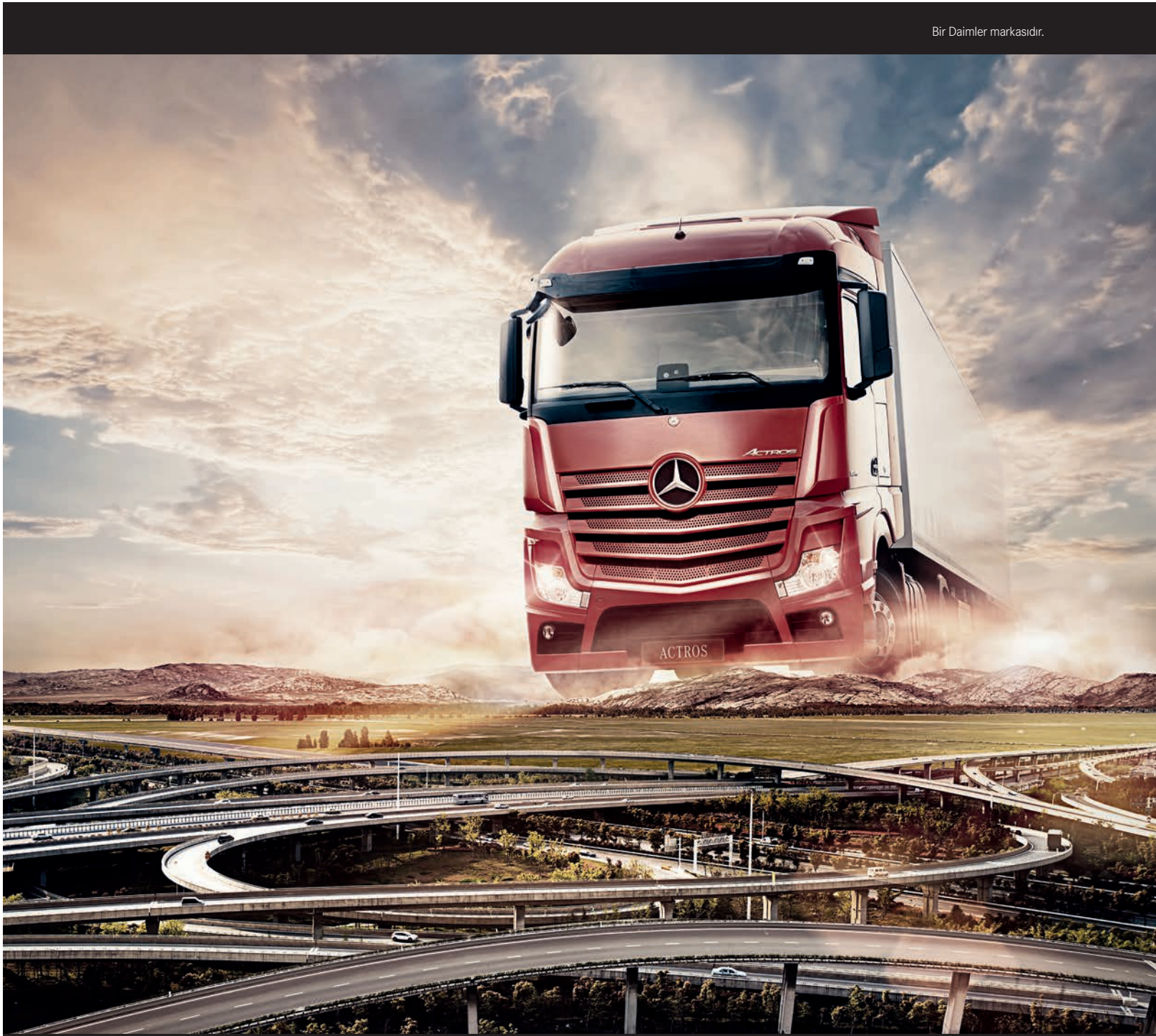
Bir Daimler markasıdır.