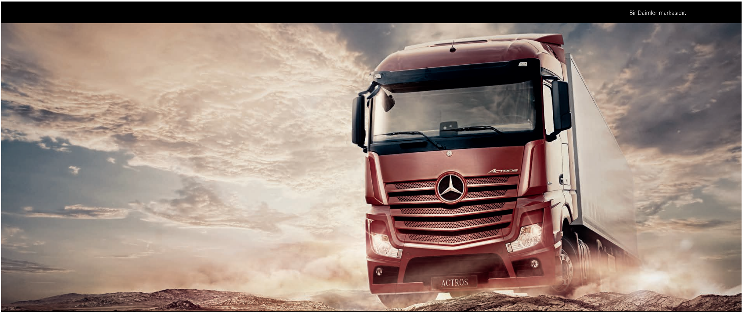
Bir Daimler markasıdır.