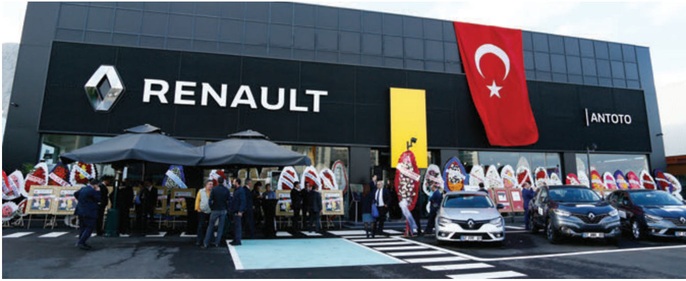
Renault-Dacia plazası 5 bin metrekarelik bir alana sahip. Çalışan sayısı da 125.