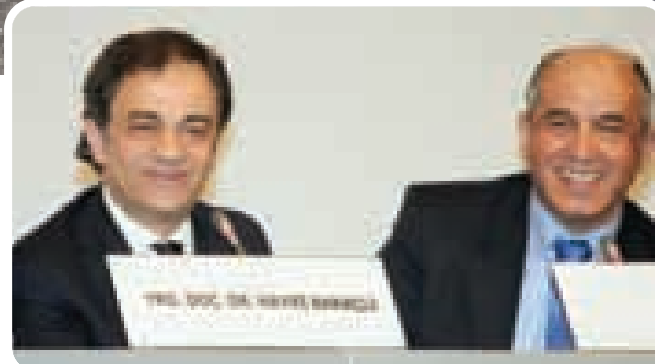
Marmara Belediyeler Birliği Sempozyumu

İstanbul Otobüs A.Ş 350 adetlik otobüs ihalesinde kazananların isimlerini asil ve yedek liste halinde internet sitesinde yayınladı. www.istanbulotobus.com.tr internet sitesinden yapılan duyuruda Anadolu, Beyoğlu ve İstanbul Dar Bölge ihalesinde kazananlar asil ve yedek liste halinde yer alıyor. ■