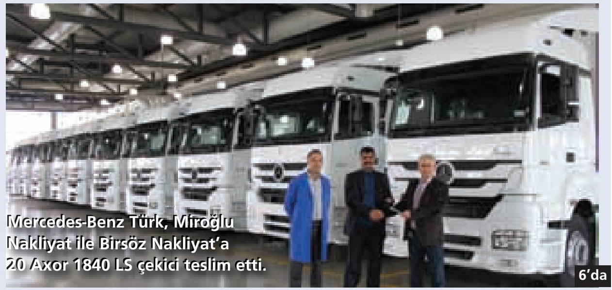
Mercedes-Benz Türk, Miroğlu Nakliyat ile Birsöz Nakliyat'a 20 Axor 1840 L5 çekici teslim etti. 6'da

Başbakan Erdoğan, İzmit Körfezi'nin çevresinde yapılan altyapı ve üstyapı çalışmaları ve Körfez'in temizlenmesinin yanı sıra sahil düzenlemeleriyle ilgili bilgi aldı. Başkan Karaosmanoğlu, Başbakan Erdoğan'a; yapımı tamamlanan ve devam eden plaj ve sahil düzenlemeleriyle İzmit Körfezi'nde canlı yaşamının yeniden başlamasıyla ilgili bilgi aktardı. ■