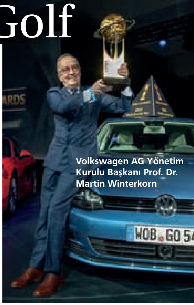
Volkswagen AG Yönetim Kurulu Başkanı Prof. Dr. Martin Winterkorn

Geçtiğimiz günlerde Avrupa'nın en prestijli ödülü olarak kabul edilen 'Car of the Year' (COTY) ödülüne layık görülen Golf VII, 23 ülkeden 66 otomobil gazetecisinden oluşan WCOTY jürisinden de 'Herkeseye uygun bir araç varsa, bu Golf'tür' şeklinde onay aldı.